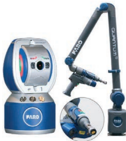
» Slika 5: FARO Vantage Laser Tracker in FAROArm

naprav tako omogoča izvajanje kompleksnih meritev na razdalji, 3D-skeniranje visoke natančnosti velikih objektov ter natančno pozicioniranje naprav v proizvodnih linijah in reševanje številnih drugih izzivov.