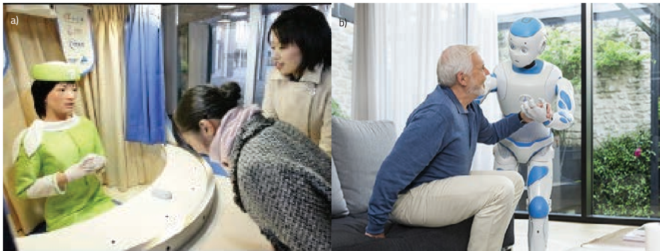
» Slika 3: Roboti-ljudi na radnom mjestu a) Ginolda Repliee na recepciji [14], b) U kući android Romeo kao pomoć starima i bolesnima [15]

mnogim bolnicama koristi laparskopski robot da Vinci za određene radikalne operacije. Zbog svoje preciznosti i manje naknadnih komplikacija, pacijenti ga preferiraju i spremni su platiti dodatnu cijenu, da bi se operacijski zahvat izvršio s njim. [1]