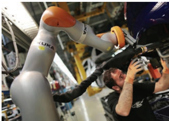
» Slika 1: Rad s robotom u Fordovoj tvornici automobila u Kölnu, Njemačka [7]

Već i danas sofisticirani strojevi i roboti imaju relativno visoku „inteligenciju“ usporedivu s ljudskom. Ona iznosi kao i prosječna ljudska inteligencija tj. oko 100 IQ. Prema nekim predviđanjima razvoj umjetne inteligencije rastao bi godišnje po stopi od 1 do 1,5