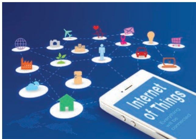
» Internet stvari posvuda: potrošnja za internet IoT će ove godine doseći 651 milijardu eura, a u 2022. godini 874 milijarde.

Na koje strateške tehnologije će ove godine morati tvrtke obratiti posebnu pozornost? Analitička tvrtka Gartner je pripremila popis deset takvih tehnologija, koje imaju značajan potencijal proboja i počinju povećavati svoj utjecaj ili će kritičnu točnu doseći u sljedećih pet godina. Tvrtka naglašava, da korisnici nekog od tih trendova mogu kombinirati – primjerice, umjetnu inteligenciju u obliku automatiziranih stvari i obogaćenu inteligenciju možemo primijeniti zajedno s internetom stvari, robnim računarstvom i digitalnim dvojnica, čime bi dobili visoko integrirane pametne prostore. Gartner preporučuje voditeljima IKT-odjela i tvrtki, da se što prije potrudu dobro poznati niže navedene tehnologije.