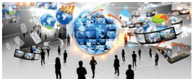
» Digitalizacija unatoč stagnaciji tržišta: 2019. godinu će obilježiti digitalna preobrazba i ubrzano seljenje u oblak.

» Svjetska potrošnja za IKT (u milijardama eura): Rast potrošnje za IKT: najveći rast biti će u segmentu programske opreme (8,3 %) i IT-usluga (4,7 %), a najmanje u segmentu podatkovnih centara (1,6 %) i komunikacijskih usluga (1,2 %) Napomena: Iznosi u dolarima su preračunati u eure prema tečaju 8.1.2019.