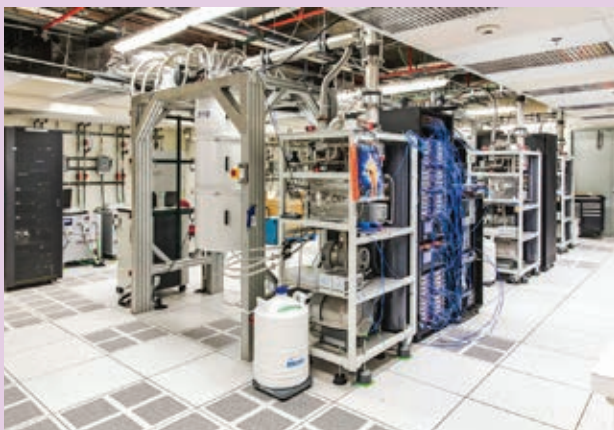
» Odgovori na kompleksne probleme: IBM-ova kvantna računala povezana u oblak

Kvantno računarstvo: Iako je u svojoj ranoj fazi, kvantno računarstvo obećaje, da će naći odgovore na probleme, koji su prekompleksni, da bi bili riješeni s pomoću tradicionalnih računala. Od razvoja kvantnog računarstva najviše će koristiti imati automobilska, financijska, osiguravajuća, farmaceutska i vojna industrija. Direktori informatike bi morali početi učiti, kako će moći primijeniti kvantno računarstvo za rješavanje stvarnih poslovnih problema, predvidivo u 2023. godini ili najkasnije u 2025. godini.