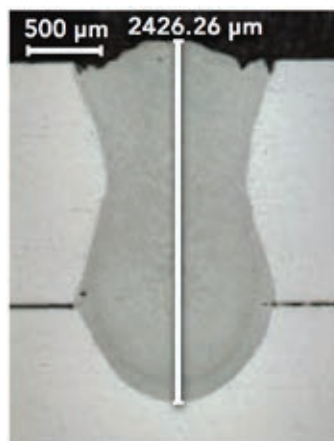
» Slika 3: Makroobris prekrivnog zavarenog spoja na aluminijskoj leguri serije 5000 debljine 1,6 mm, gdje je bila postignuta veća penetracija, zavar bez poroznosti, a tijekom zavarivanja nije došlo do štrcanja taljevine.

Taj pristup djeluje i pri zavarivanju aluminijskih legura, jer vodeći rub obručaste laserske zrake povisuje temperaturu aluminijske legure na dovoljno visoku razinu, da poveća apsorpciju laserske zrake određene valne duljine. Zatim središte zrake ostvaruje spoj, koji je radi predgrijavanja iznimno stabilan. Stražnji rub obručaste laserske zrake održava taljevinu zavara dovoljno dugo na odgovarajućoj temperaturi, da omogućiti rasplinjavanje taljevine zavara. Kako je spoj stabilan i materijal ne očvrstne prebrzo, čitav proces zavarivanja je dosljedniji i procesni prozor veći. Konačni rezultat zavarivanja prikazan je na slici 3. Nastali zavar je ujednačen, ima jednaku dubinu penetracije i višu kvalitetu zavara bez propusnosti, a zavarivanje se odvija bez štrcanja.