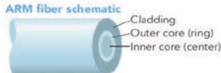
Basic FL-ARM focused spot power patterns

postići s primjenom specijaliziranog prstena Coherent's FL-ARM, koji sadrži vlakno za objedinjavanje i isporuku. To vlakno je tradicionalno sastavljeno od kružne jezgre obuhvaćene s vlaknom oblika obruča. Te sustave možemo načiniti objedinjavanjem jednog do četiri odvojena vlaknasta lasera, čime osiguravamo ukupnu maksimalnu snagu 2,5 do 10 kW. Bez obzira na vrstu konfiguracije ili aplikacije, u svim slučajevima zajednički profil zrake (to je snaga u sredini i u obruču) možemo na zahtjev neovisno podesiti. Odvojeni sustavi za upravljanje snagom sa zatvorenom petljom za središnju zraku i zraku obruča osiguravaju i izvrsnu stabilnost u čitavom području podešavanja snage, koja je od 1 % do 100 % najveće nazivne izlazne snage. Zrake iz jezgre i obruča mogu se